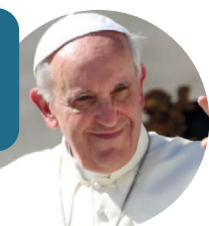
Pape François Journées Mondiales de la Jeunesse

"Laissez le Seigneur vous parler et vous verrez votre vie se transformer et se remplir de joie"