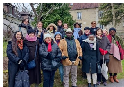
Une partie du groupe