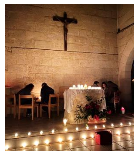
La prière des frères