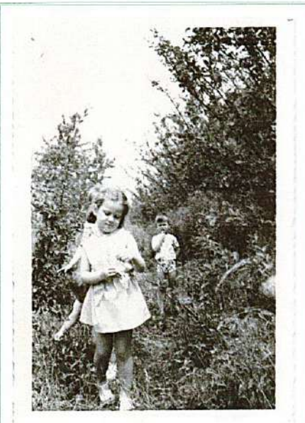
En juin 1967, enfants en route pour l'école Pasteur, à travers les vergers qui existaient au 250 de la route de l'Empereur (aujourd'hui locaux SagemCom)

L'essentiel est construit en maisons individuelles. Il y a quelques immeubles d'appartements dont les principaux sont cités ci-après.