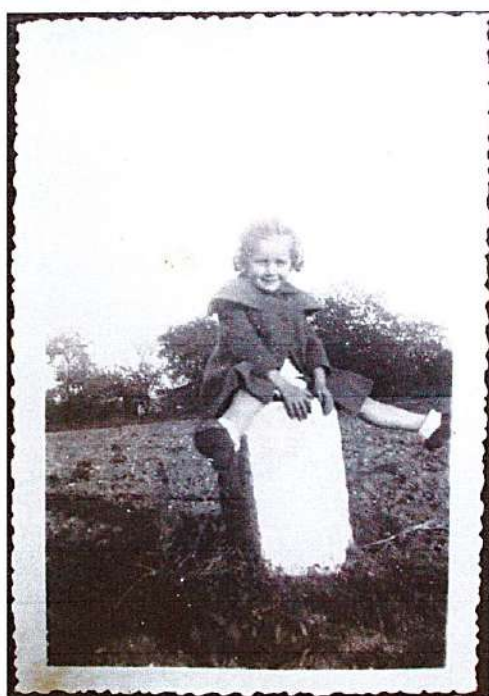
Cette borne kilométrique était au bord des champs où a été construit le centre IENA

Les petites maisons existant aux numéros 145 et 147 ont été détruites en 1976 pour la création du centre commercial Iéna. Cet ensemble comporte aux rez de chaussée et sous-sol des commerces et à l'étage des logements. Il était prévu une station d'essence entre le café Montébello et la rue, mais une opposition locale l'a fait interdire. Elle sera construite au coin de la rue Otis Mygatt