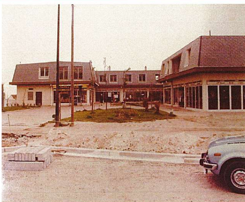
Le centre IENA en fin de chantier