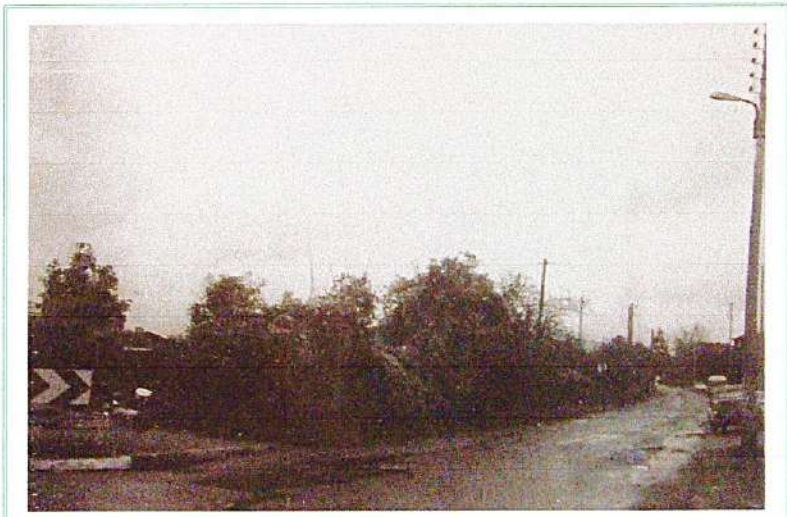
La route de l'Empereur au niveau du numéro 255 en 1975