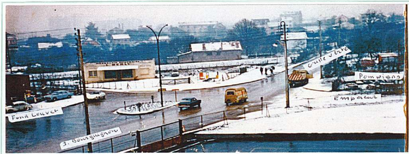
En 1967 construction, au 112 de la route de l'Empereur, de la caserne "provisoire" des pompiers

Au niveau du 272, la rue des Dahlias est percée en 1960