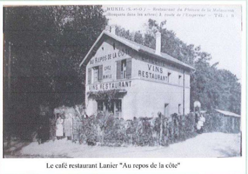
Le café restaurant Lanier "Au repos de la côte"

Initialement la numérotation des maisons de la route de l'Empereur commençait près de la place de Buzenval. Ainsi le numéro 344 actuel était le 3 et le 353 actuel le 2. C'est vers 1935 que la numérotation a été changée pour devenir celle qui existe encore, et qui est la seule employée ici.