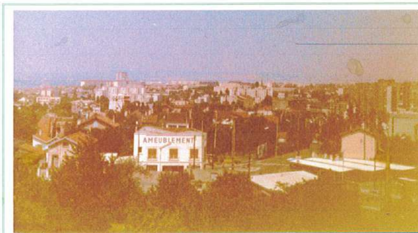
Vue sur la place Henri Regnault en 1974, avec, à gauche, l'ameublement Deluthault, et, à droite, l'entrée de la rue du 19 janvier et les toits du marché.

Le café restaurant Lannier, " Au repos de la côte " au 3 et 7 route de l'Empereur, sur le trajet menant de Rueil au bois de Saint Cucufa, a été ouvert en 1931.