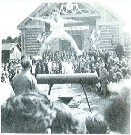
Kermesse en 1943

L'abbé Legros, successeur de l'abbé Basler, construisit la salle paroissiale avec l'aide des enfants du hameau. Dans cette nouvelle salle furent transportés le cheval d'arçon et les agrès de gymnastique qui étaient dans la sacristie. Avec l'accroissement de la population du hameau, l'Évêque de Versailles créa la nouvelle paroisse Saint Joseph de Buzenval à partir du 22 mai 1932. Elle a des territoires sur Rueil, Saint Cloud et Garches.