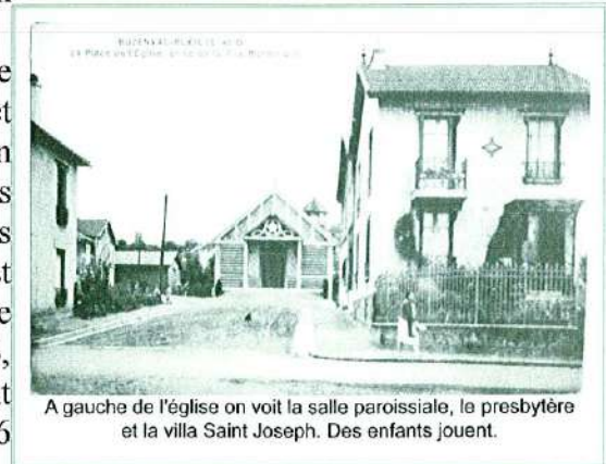
A gauche de l'église on voit la salle paroissiale, le presbytère et la villa Saint Joseph. Des enfants jouent.

L'église, avec une armature en béton et un remplissage en briques de couleurs