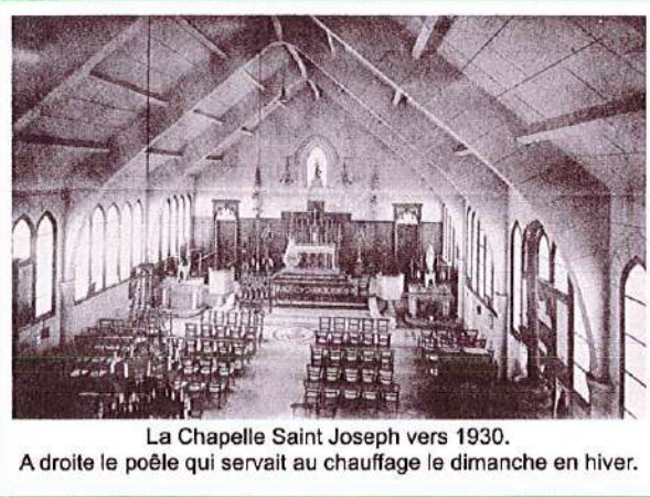
La Chapelle Saint Joseph vers 1930. A droite le poêle qui servait au chauffage le dimanche en hiver.

Les briques qui restaient sur le terrain ont été cédées avec. Certaines ont été vendues pour régler une partie des frais suite à l'achat.