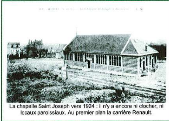
La chapelle Saint Joseph vers 1924 : il n'y a encore ni clocher, ni locaux paroissiaux. Au premier plan la carrière Renault.

Les briques qui restaient sur le terrain ont été cédées avec. Certaines ont été vendues pour régler une partie des frais suite à l'achat.